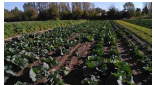
Les choux avancent bien