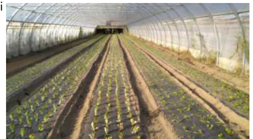
Blettes, salades, épinards