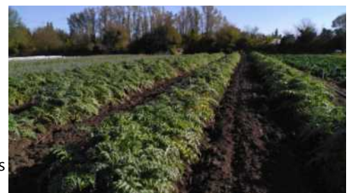
Et les plants artichauts s'étoffent