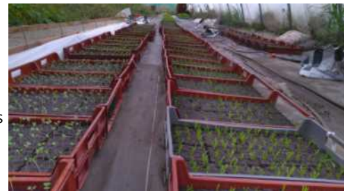
Faites du bruit, ça pousse !