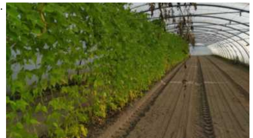
Haricots verts, encore au stade fleur, et semis de carottes, persil, betteraves