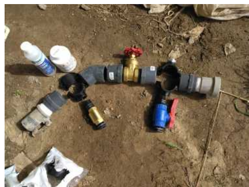
By Pass avant/après assemblage