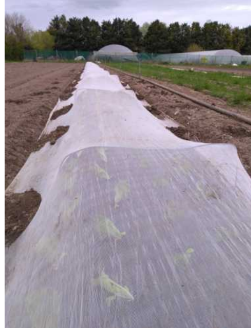
Première série de salade, avant les dégâts